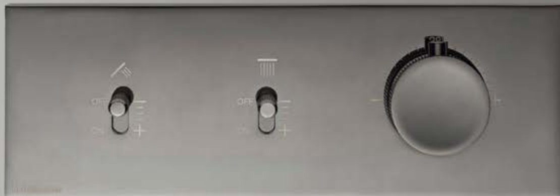
HH polished black chrome