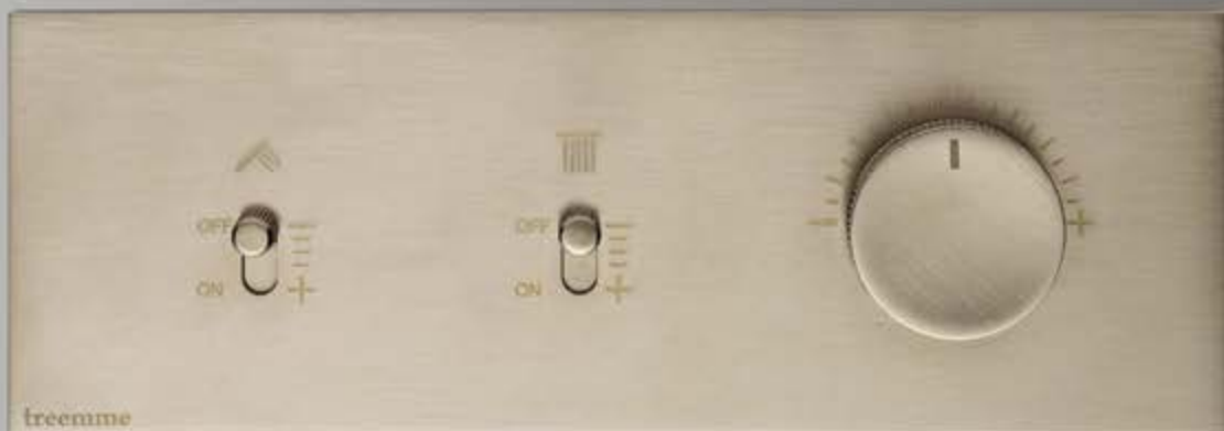
NF brushed nickel