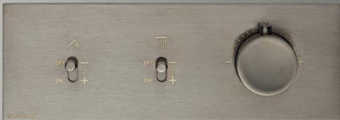
CZ brushed black chrome