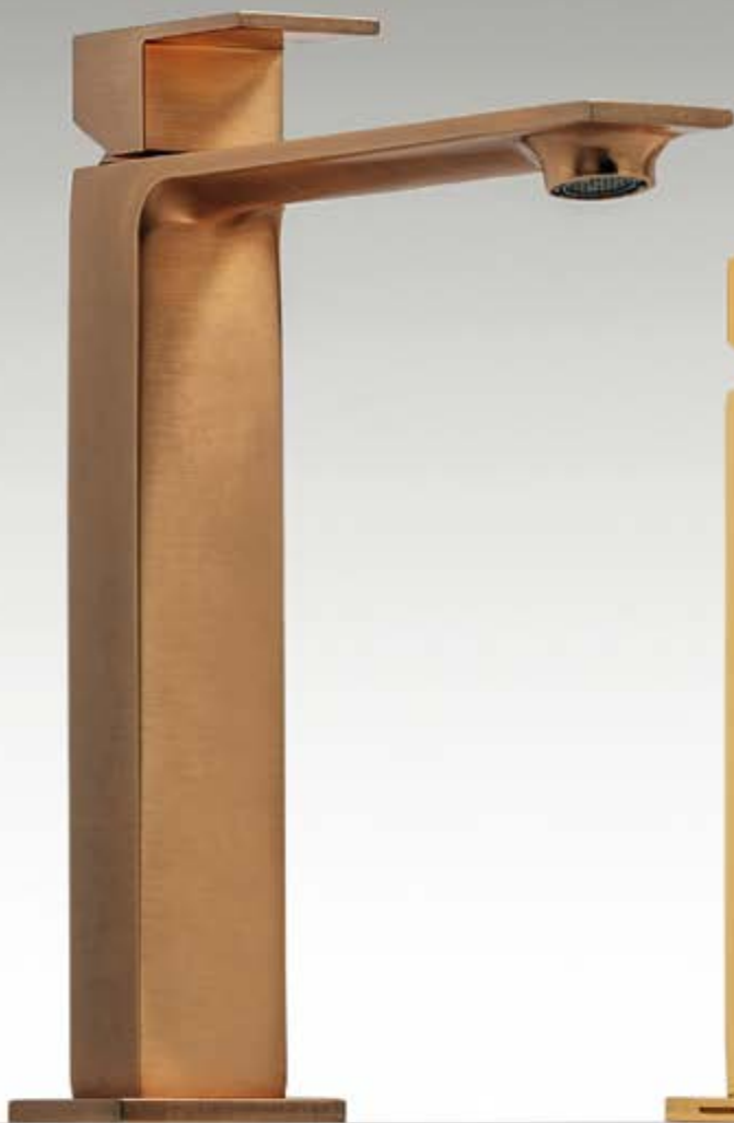
DZ brushed gold