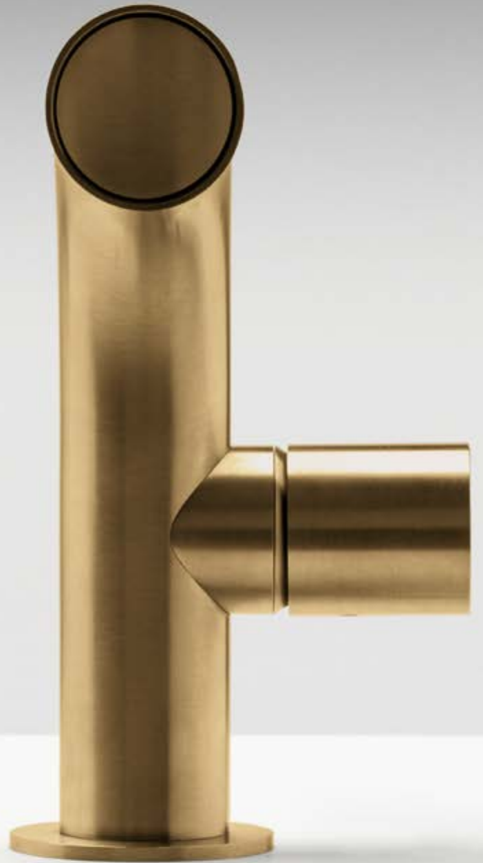
04 PVD yellow gold