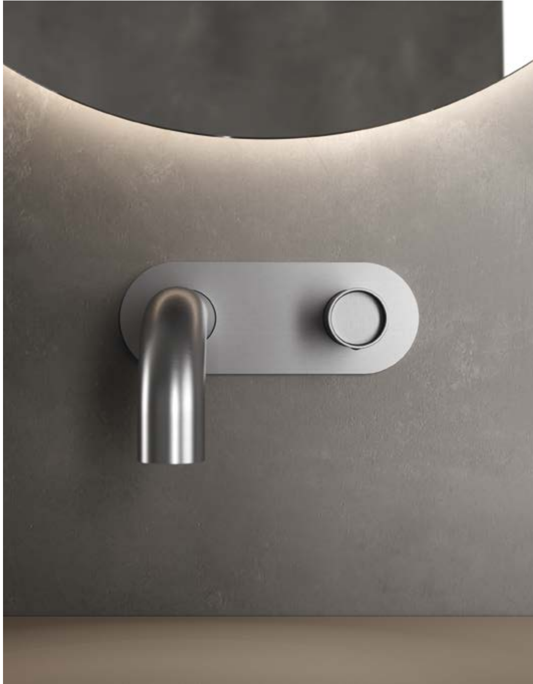
RWIT 4AA5 IS 02