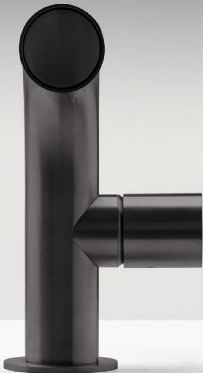
01 PVD gun metal