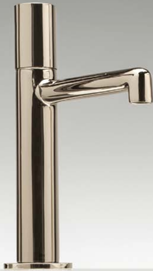
NL polished nickel