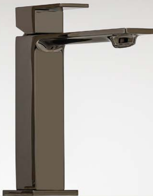
HH polished black chrome