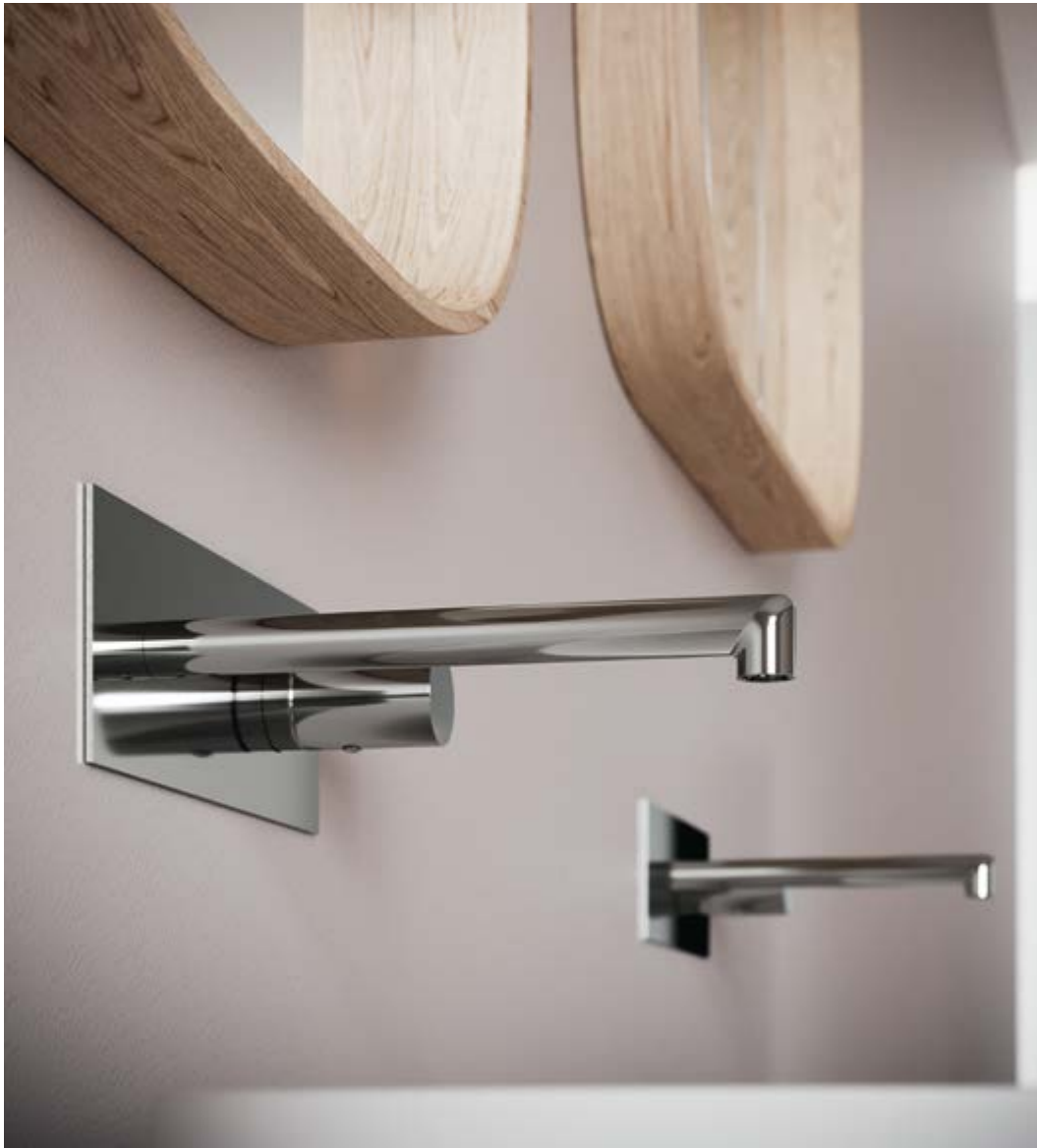
RWIT 5BA5 CC 01