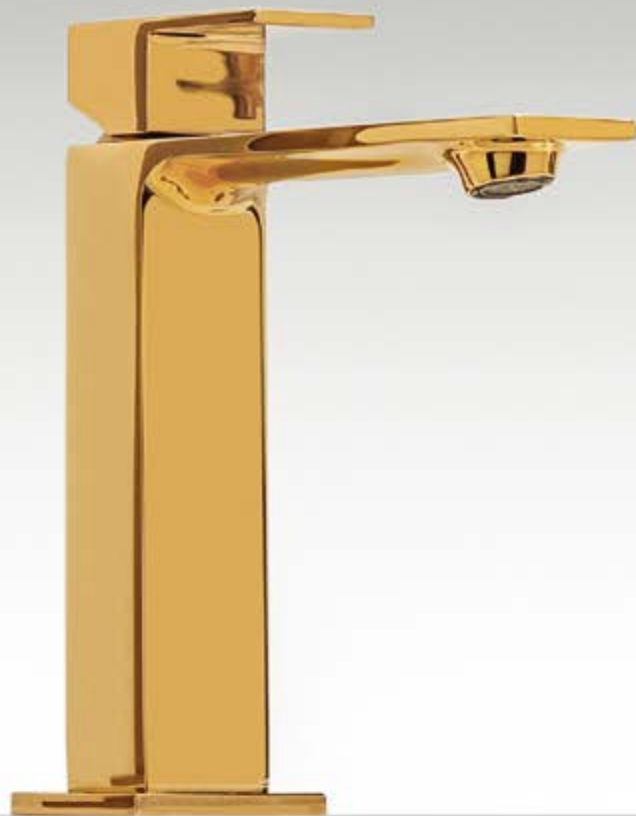
DD gold 24