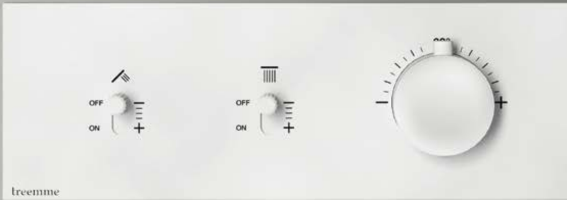
BB matt white