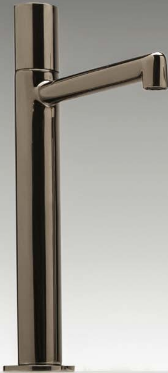
HH polished black chrome