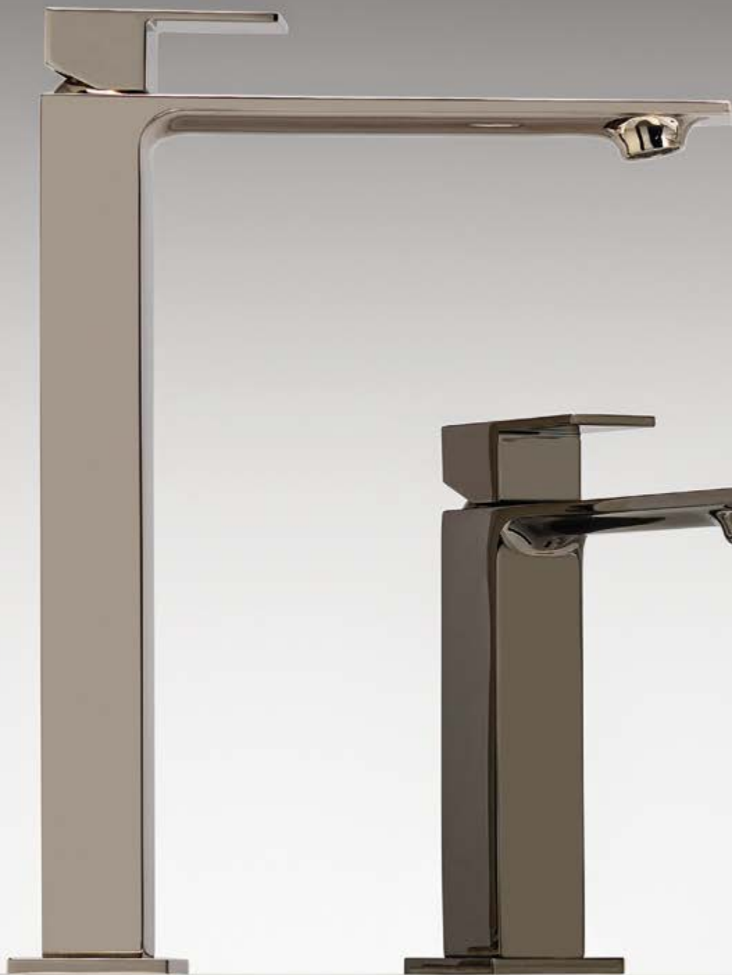
NL polished nickel