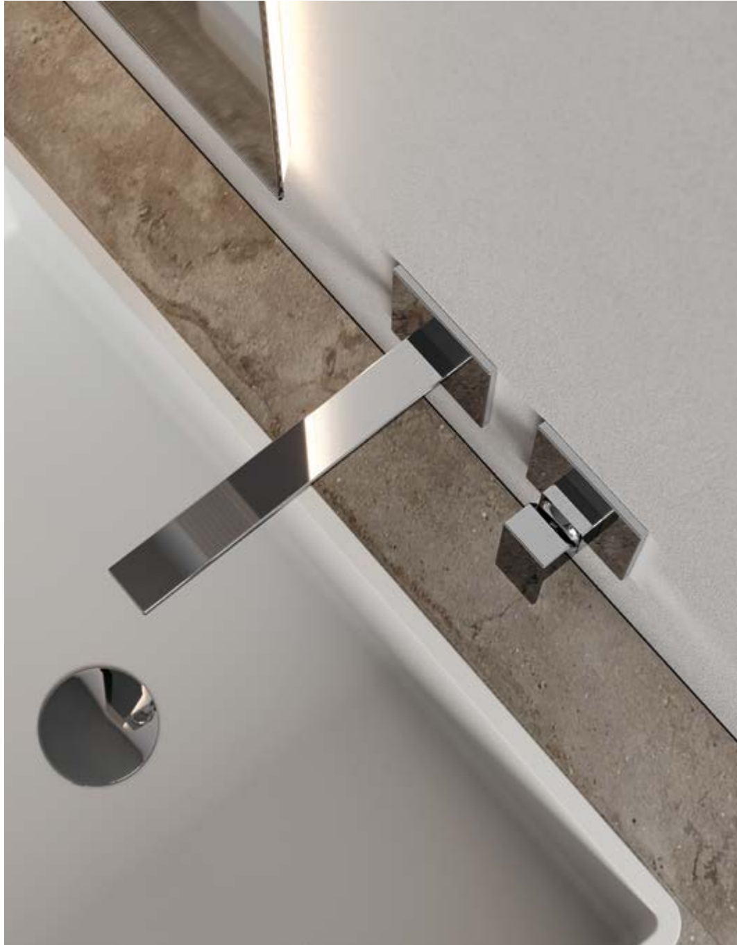
RWIT 4BC6 CC 01