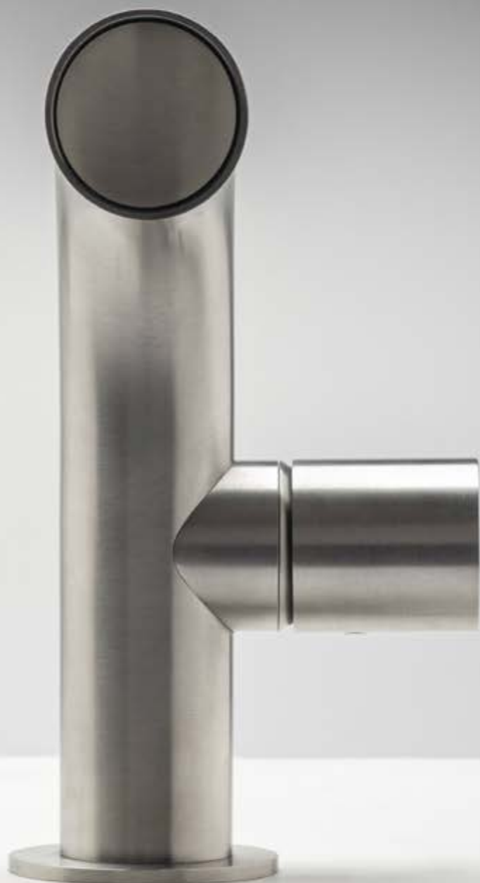
IS Inox AISI 316/L