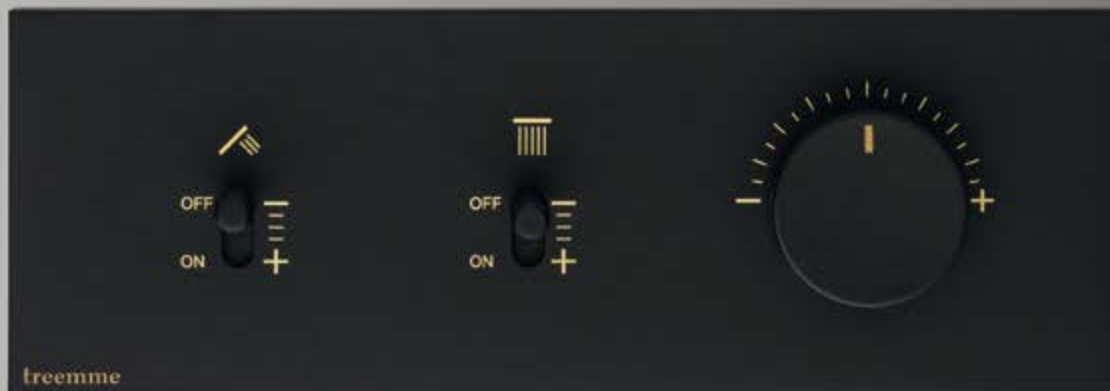
NN matt black