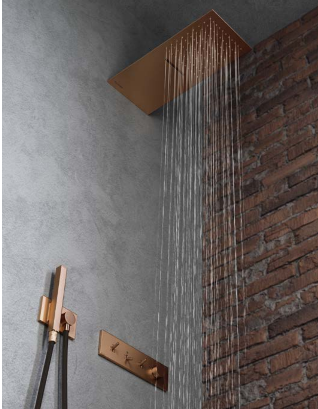
RWIT 2B90 SZ 01 + RWIT 2BF6 SZ 45 + IT RTBR 334 SZ