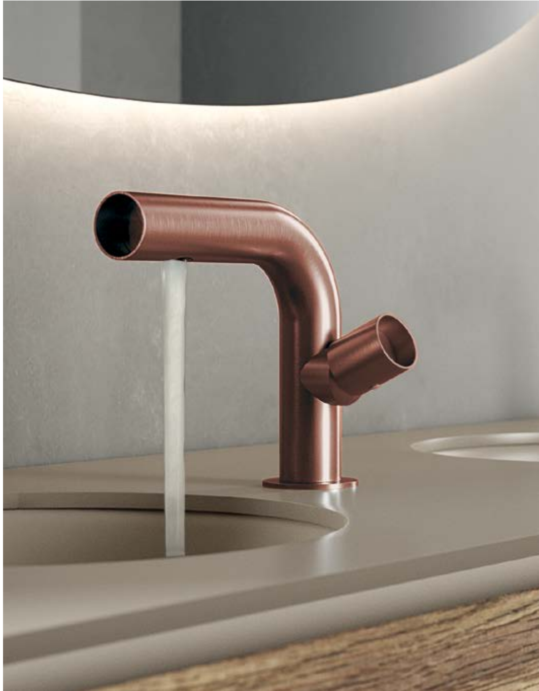
IT 4A11 03 WT ZZ