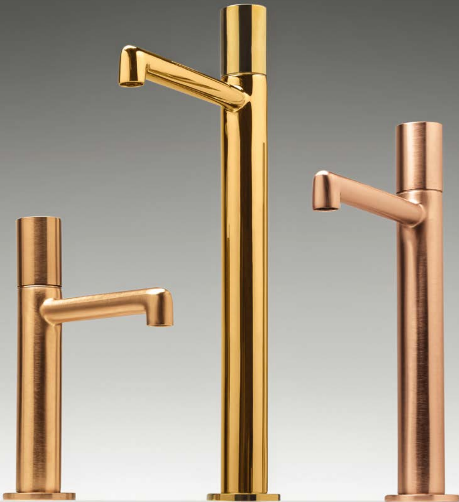
DZ brushed gold