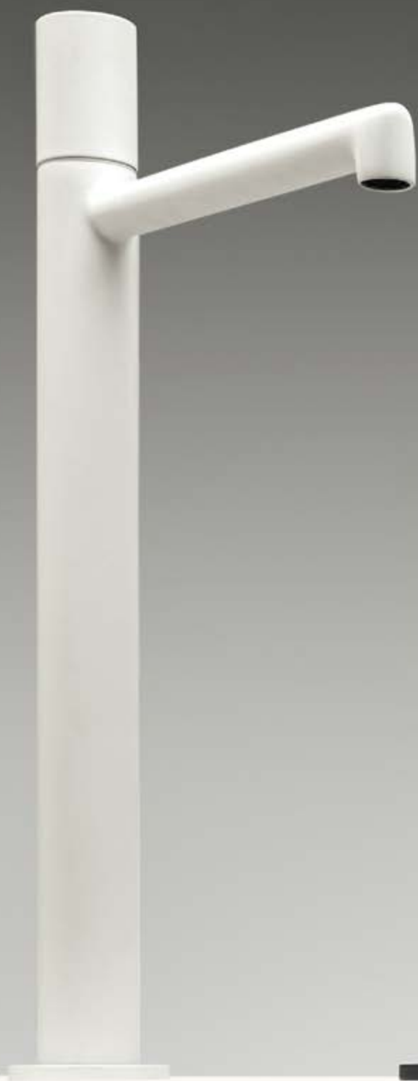
BB matt white