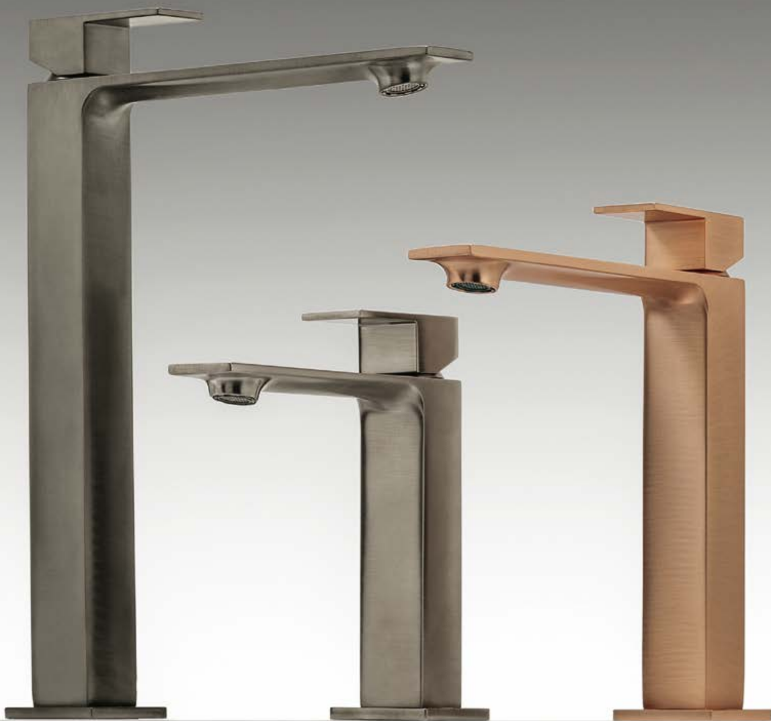
CZ brushed black chrome