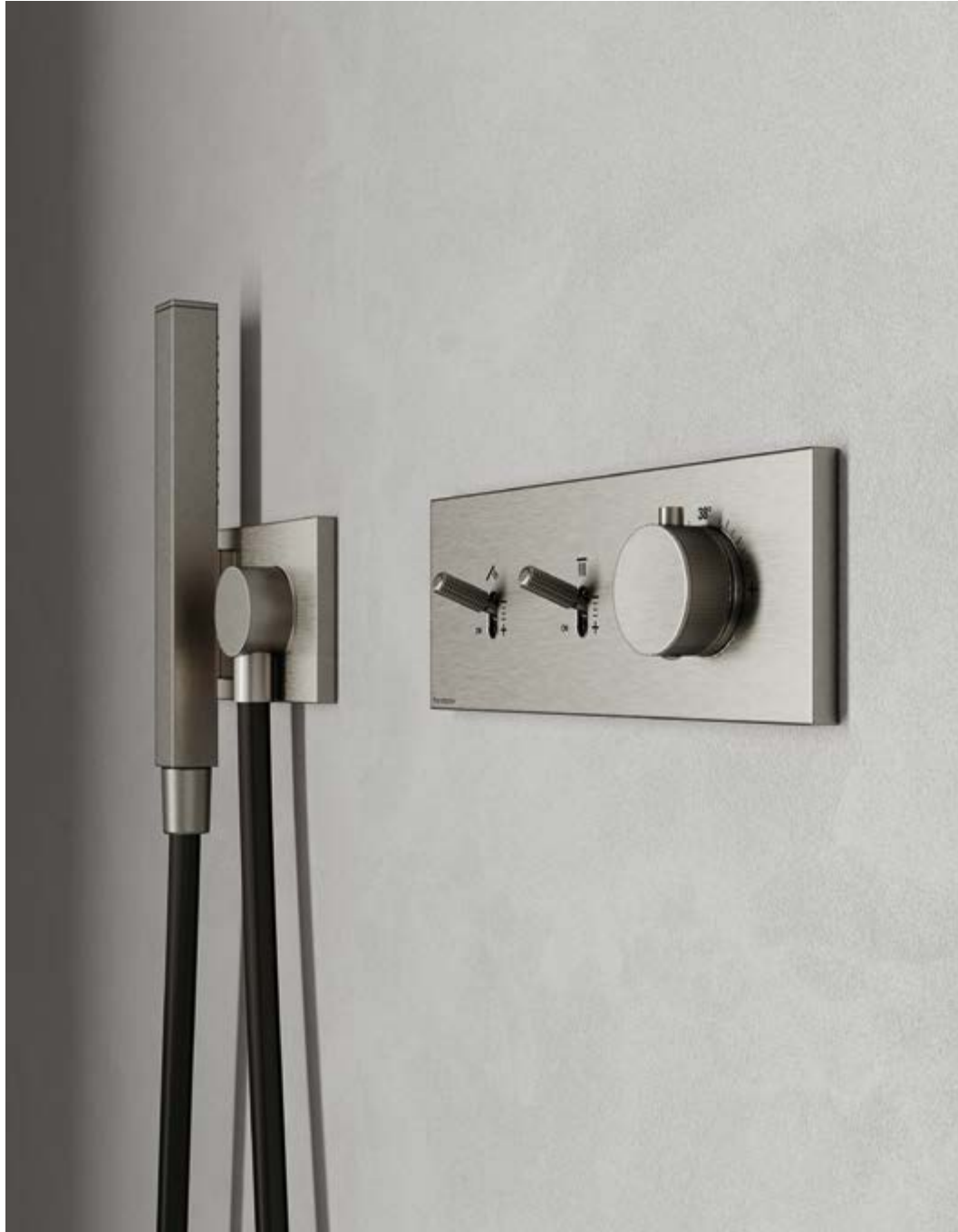
RWIT 2B86 NF 01 + RWIT 2BF6 NF 45