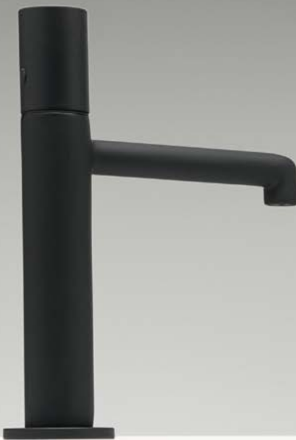
NN matt black