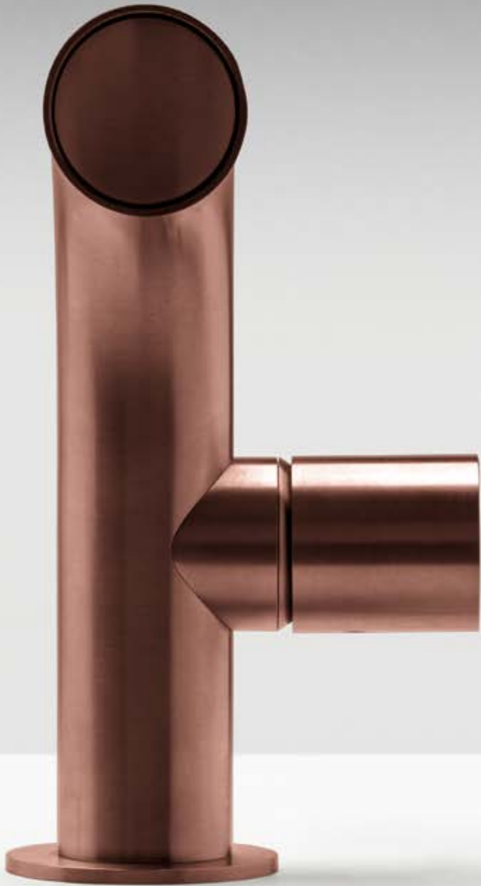
03 PVD bronze