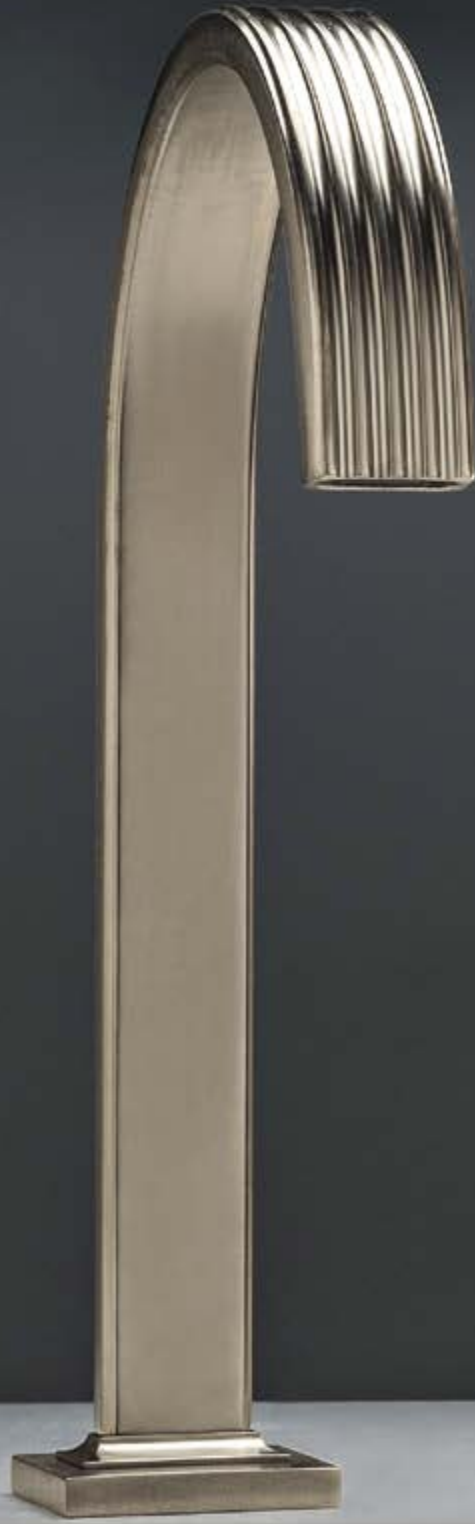
NF brushed nickel