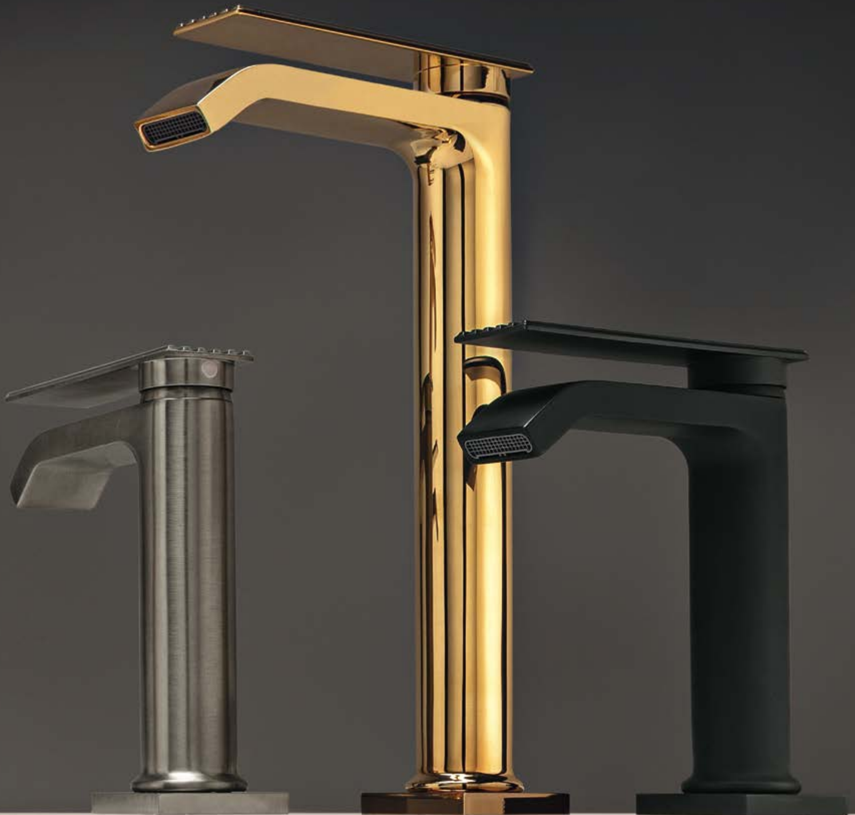
CZ brushed black chrome