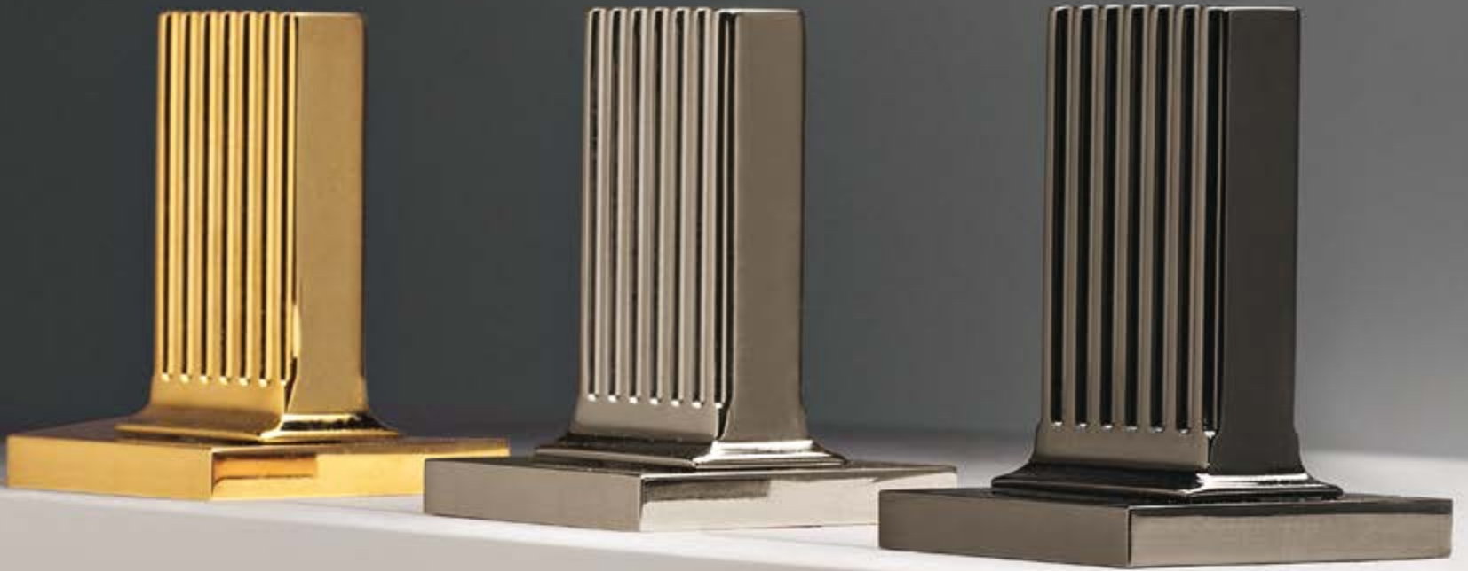
DD gold 24