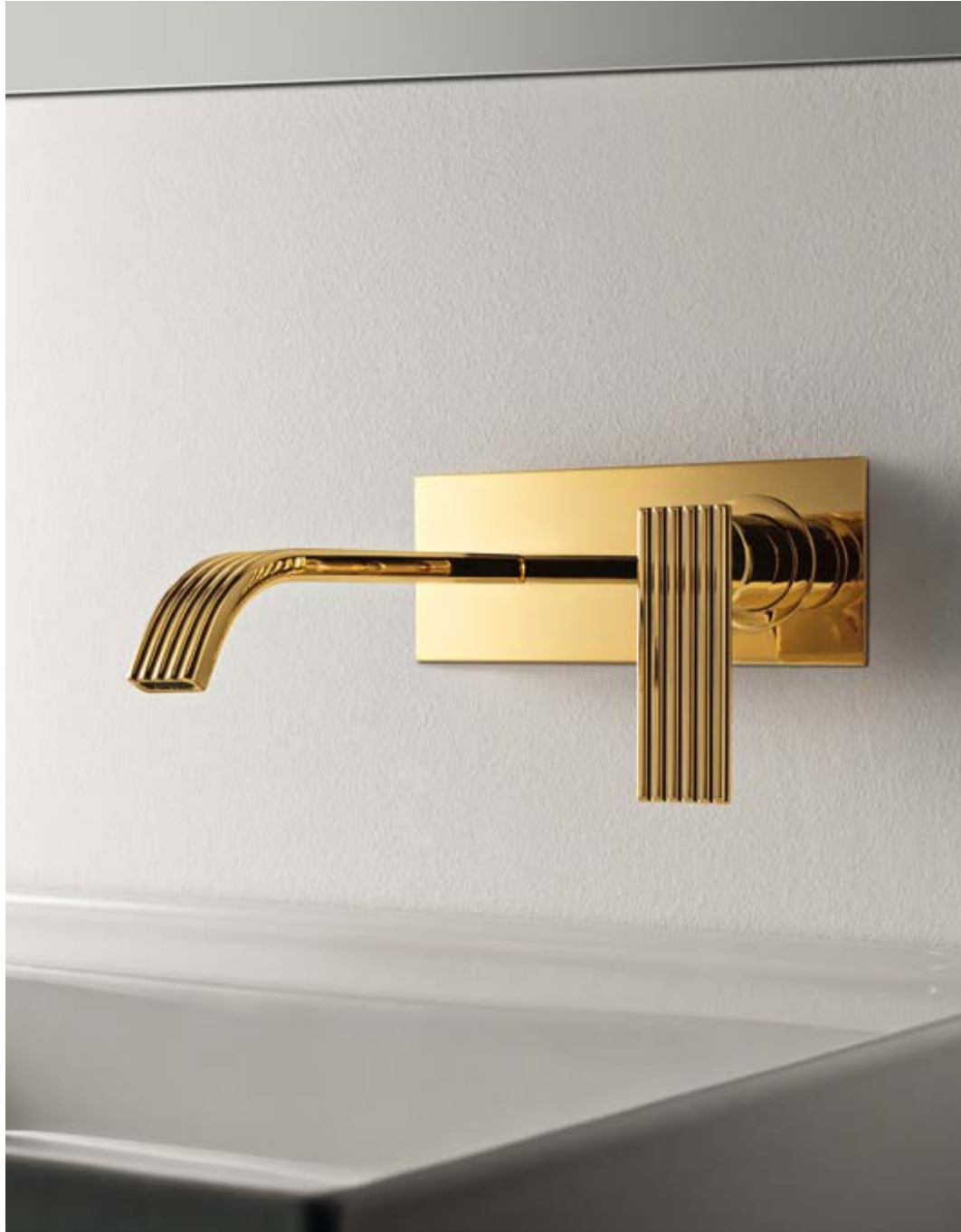
RWIT 2AA5 DD 04