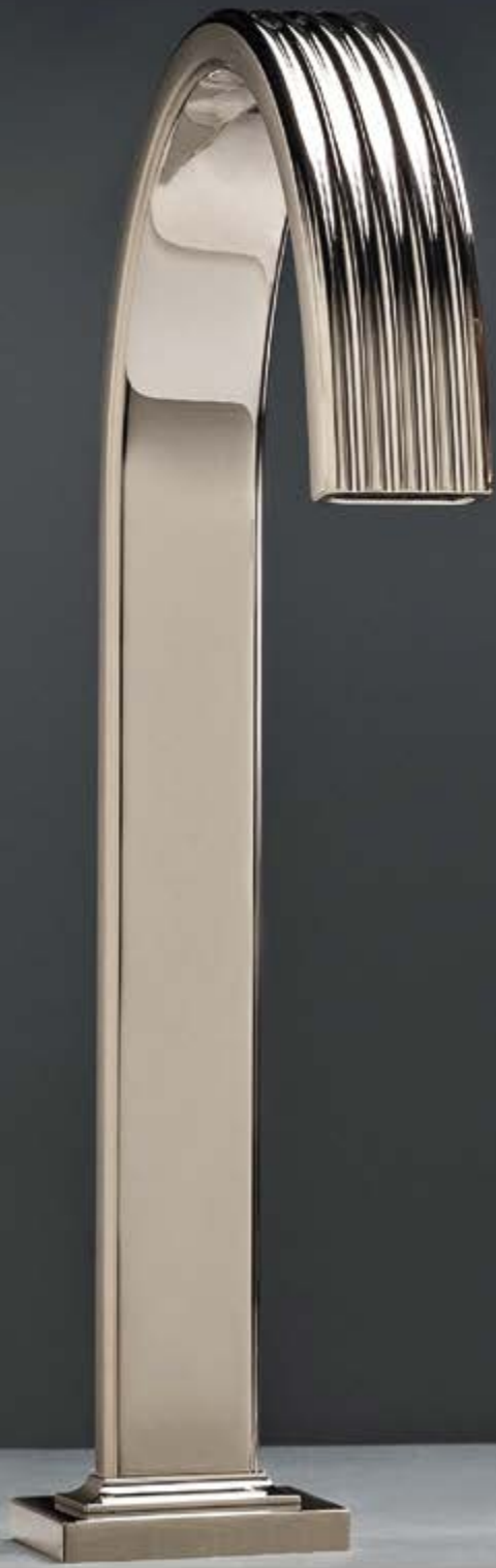
NL polished nickel