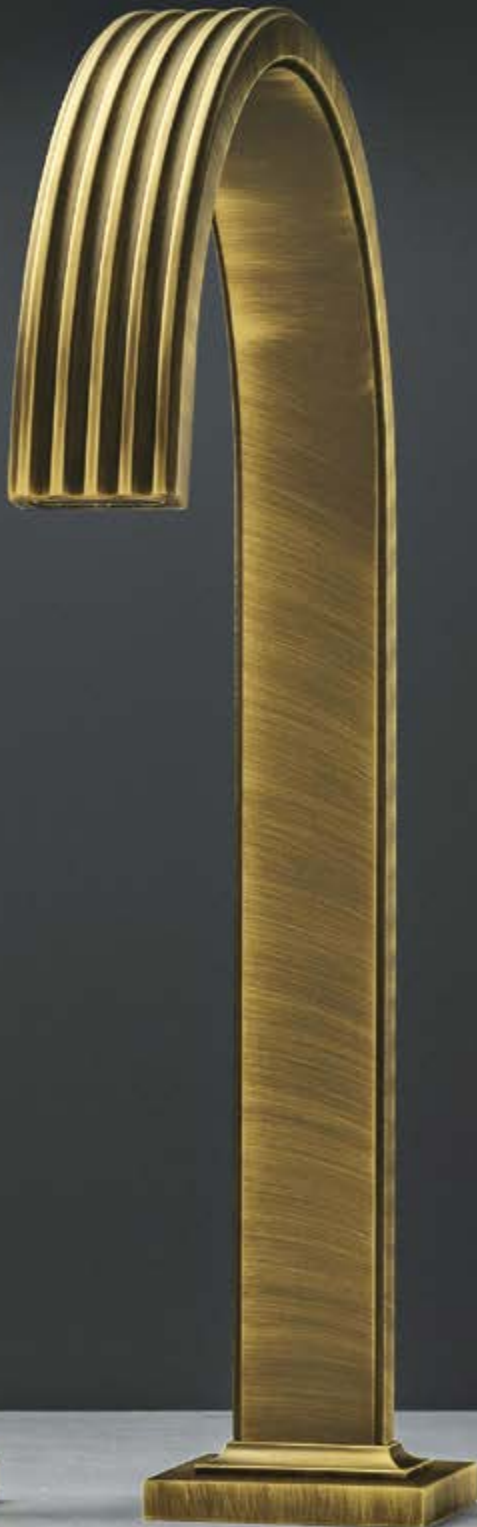
US brushed bronze