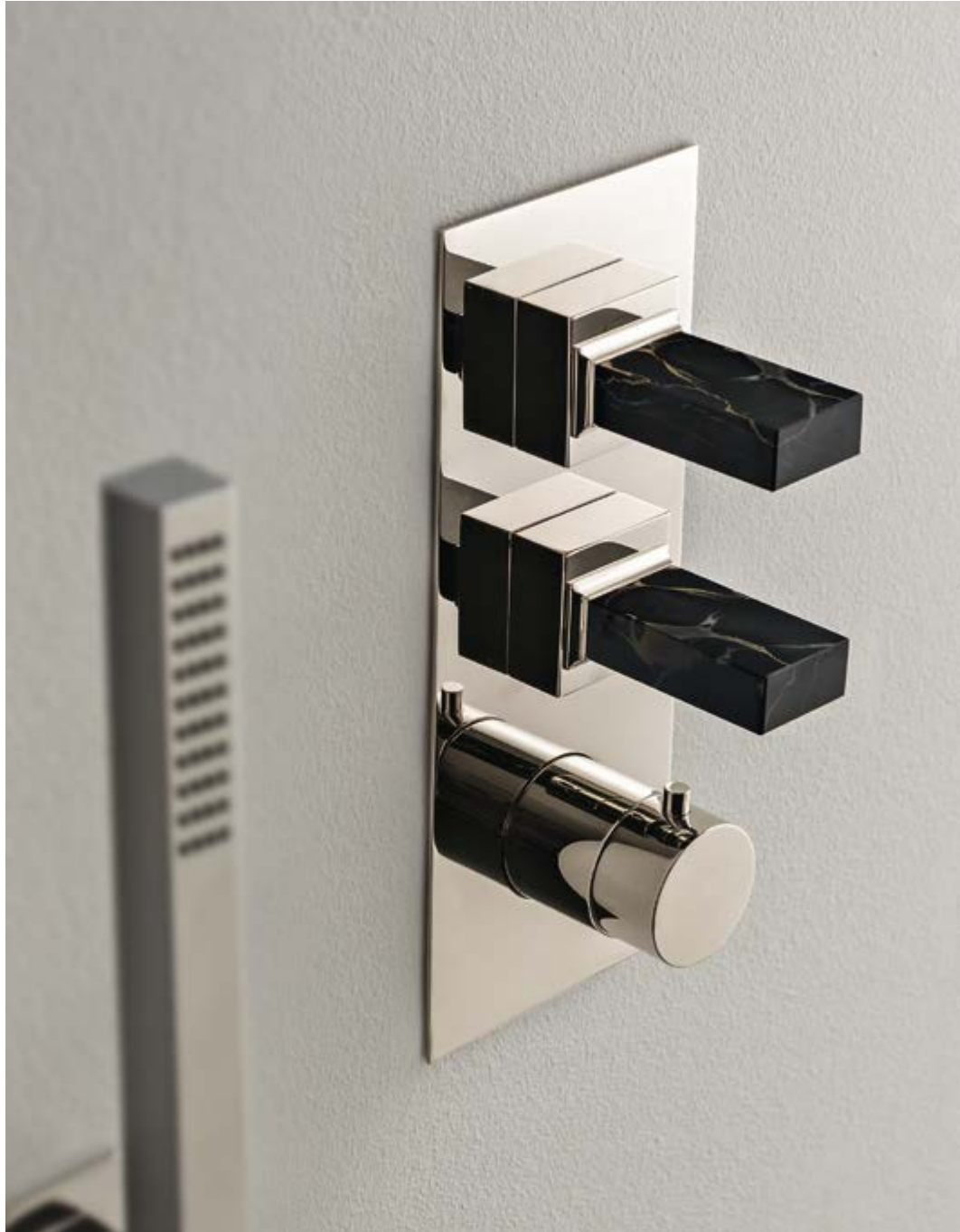
RWIT 7A86 NL K2