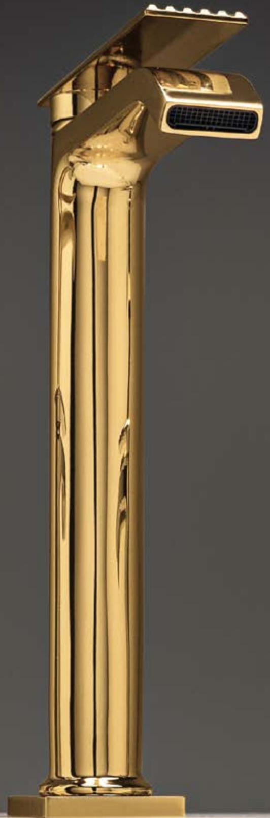
DD gold 24