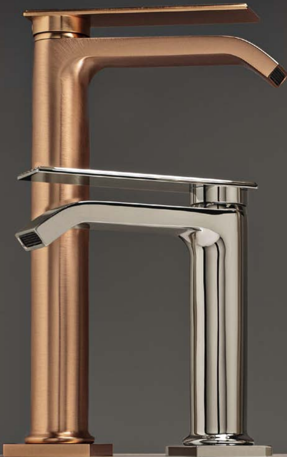
SZ brushed rose gold