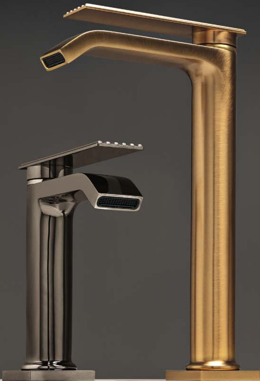
HH polished black chrome