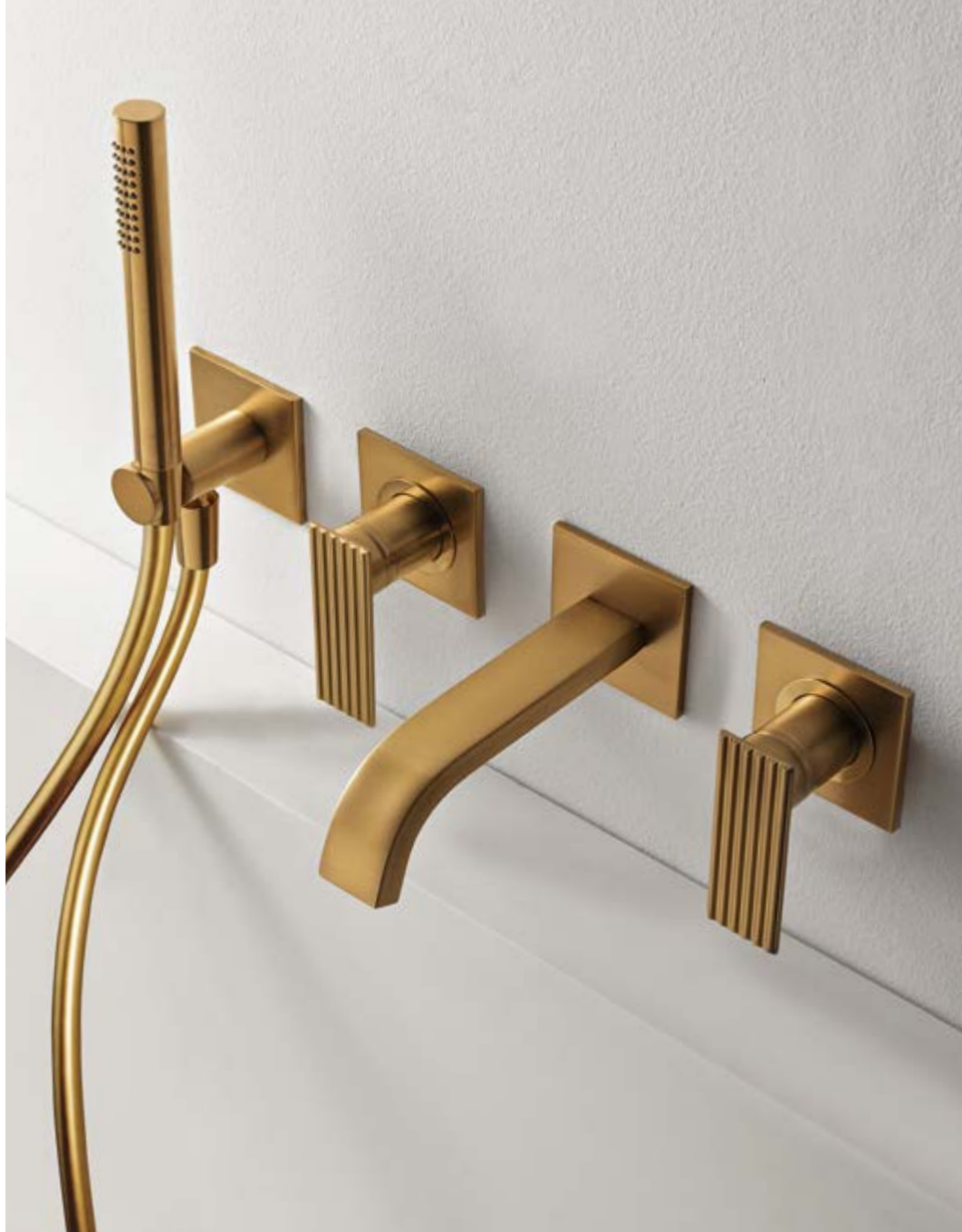
RWIT 2AD8 DZ 01