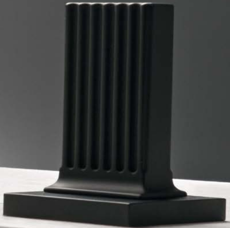
NN matt black