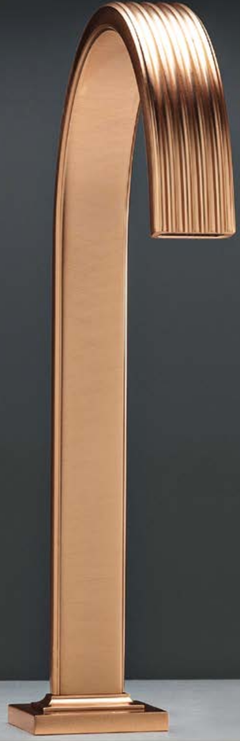
SZ brushed rose gold