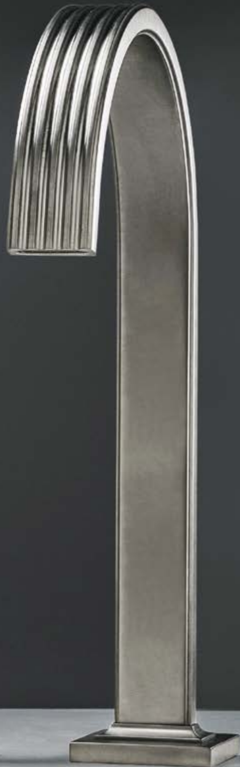
CZ brushed black chrome