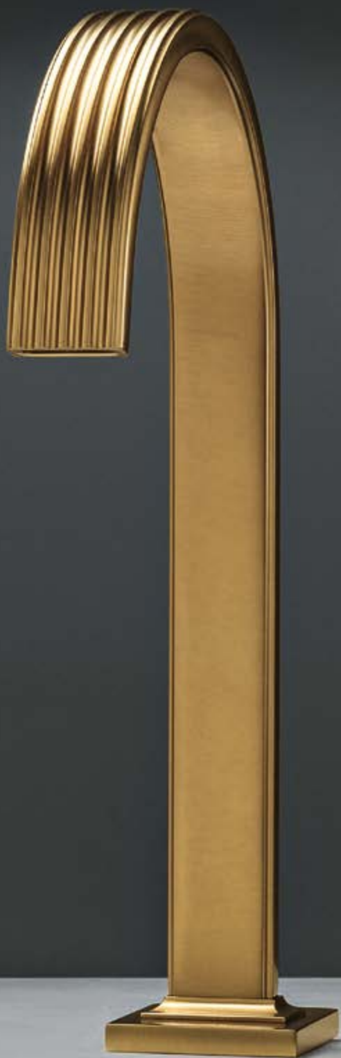
DZ brushed gold