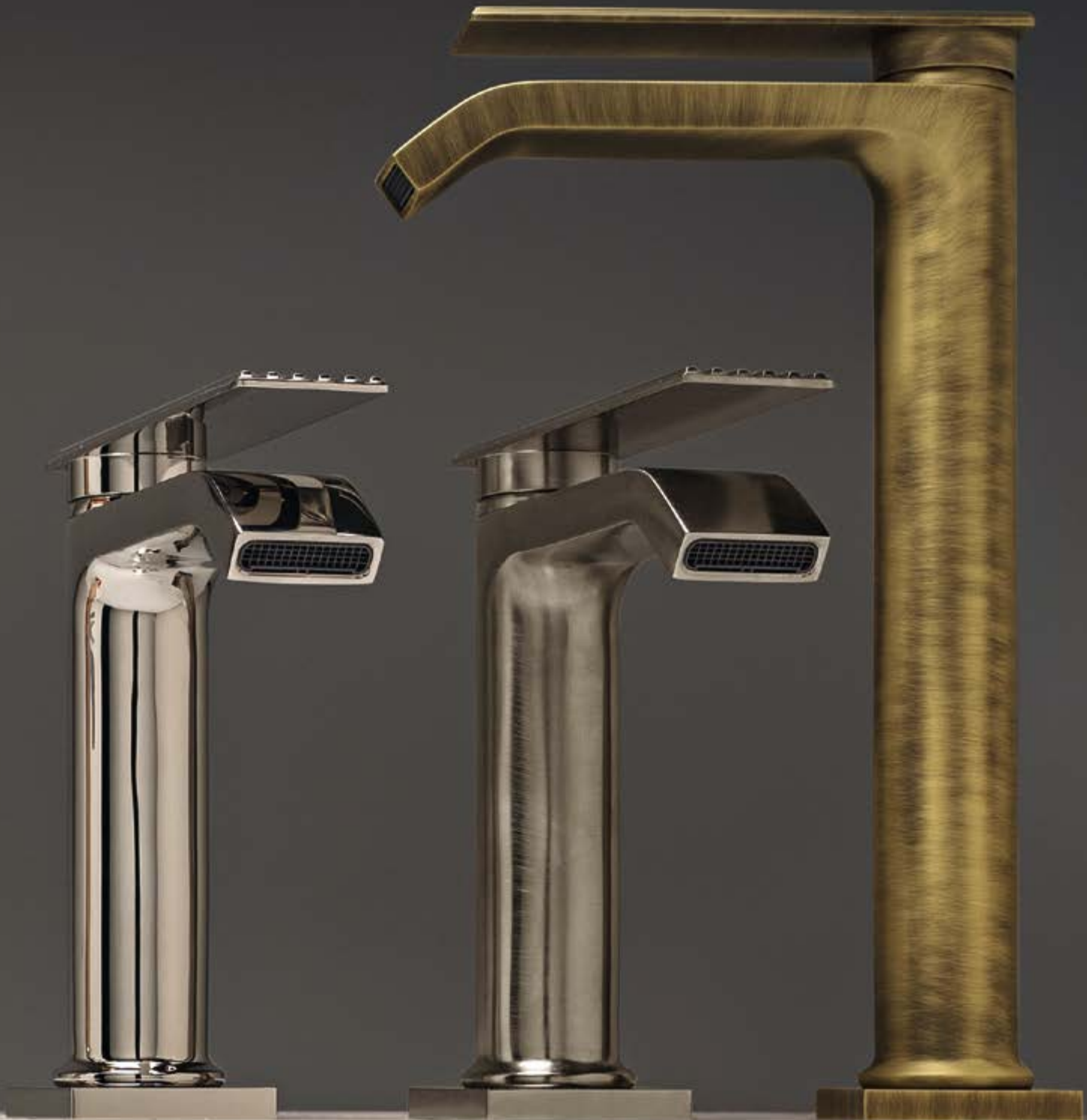
NL polished nickel